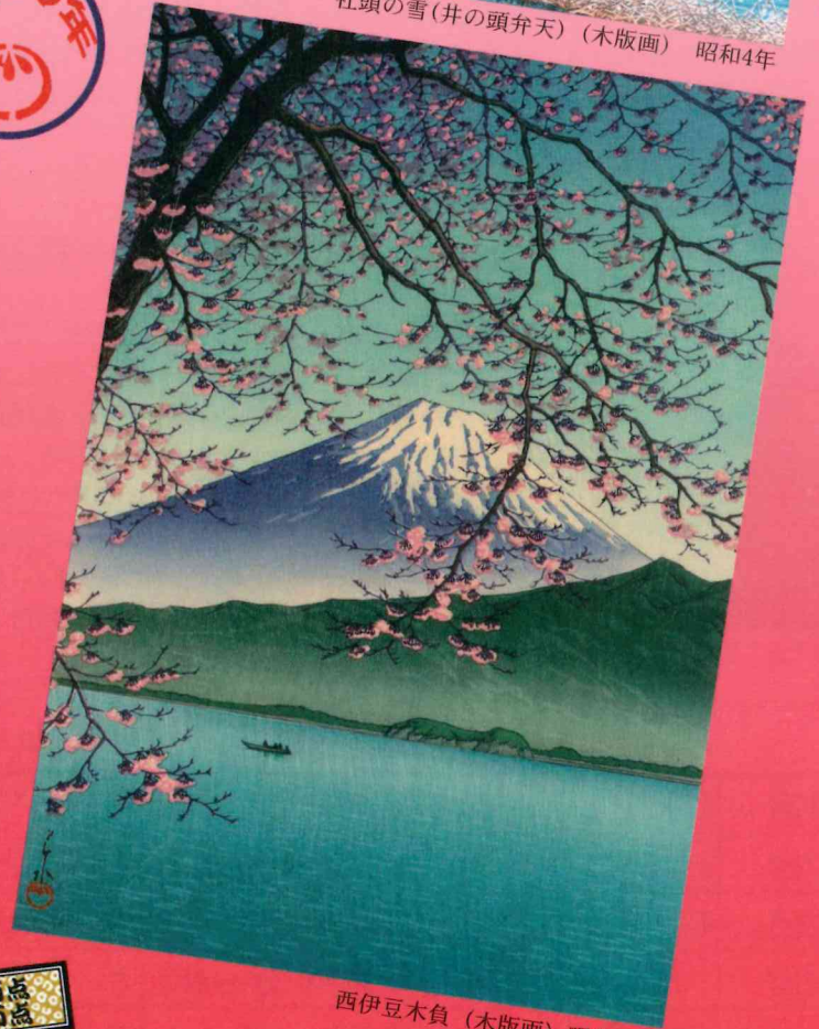
西伊豆木負 (木版画) 昭和12年