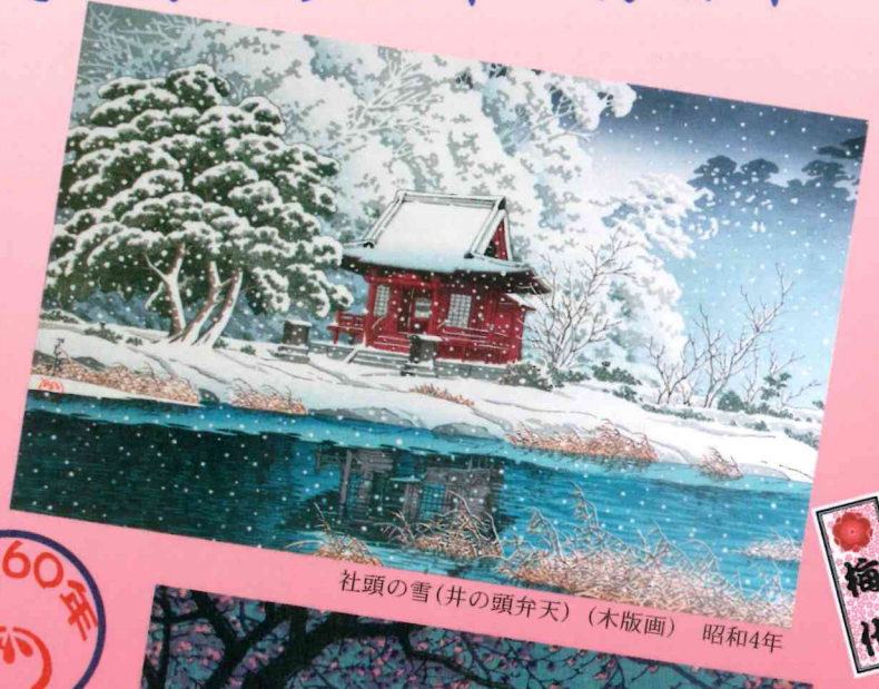
社頭の雪(井の頭弁天) (木版画) 昭和4年