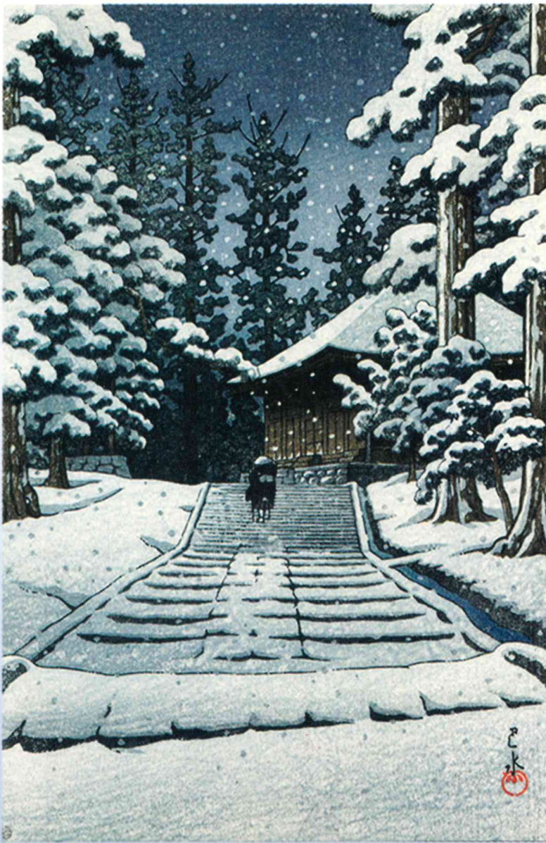
絶筆 平泉金色堂 (木版画) 昭和32年