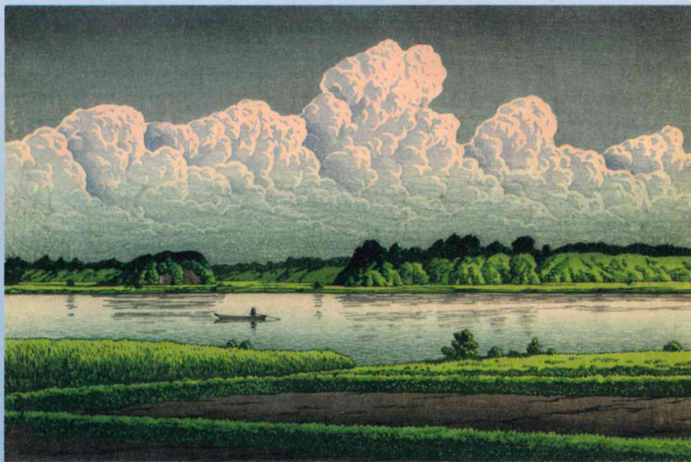
手賀沼 (木版画) 昭和5年