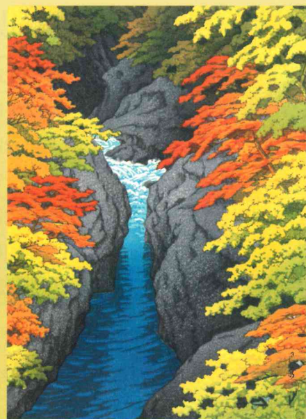
吾妻狭 (木版画) 昭和18年(1943)